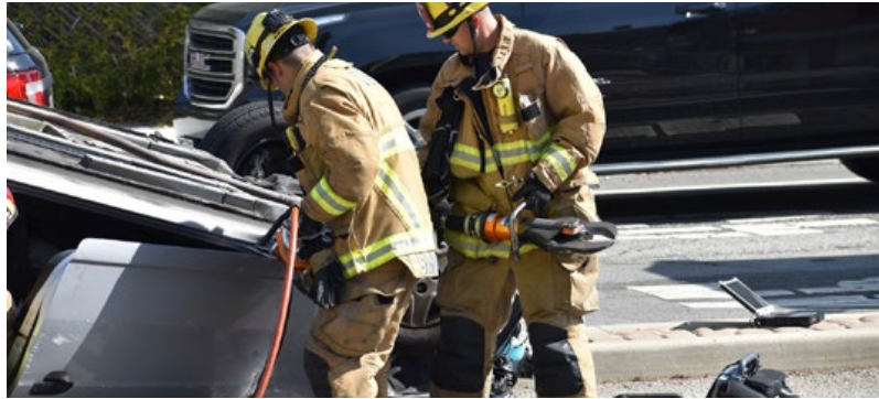
Rescate de personas en accidentes de tránsito.