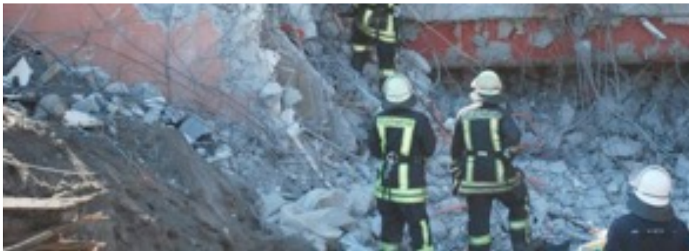
Rescatando víctimas de tragedias: un terremoto, inundaciones, accidentes en minas, etc.