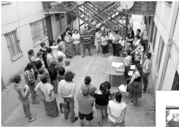
Tunla de Vecinos