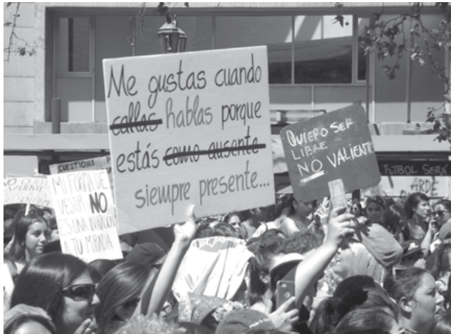
Carteles en las marchas