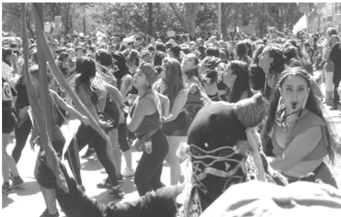
Marcha feminista 08 marzo

Deje que ellos describan lo que observaron, intentando no emitir juicios, sino realizar descripciones de lo observado. Centrar la conversación en el tipo de demandas que realizan los ciudadanos: lo hacen porque están preocupados de algunos temas y necesita que se tome conciencia de ellos.