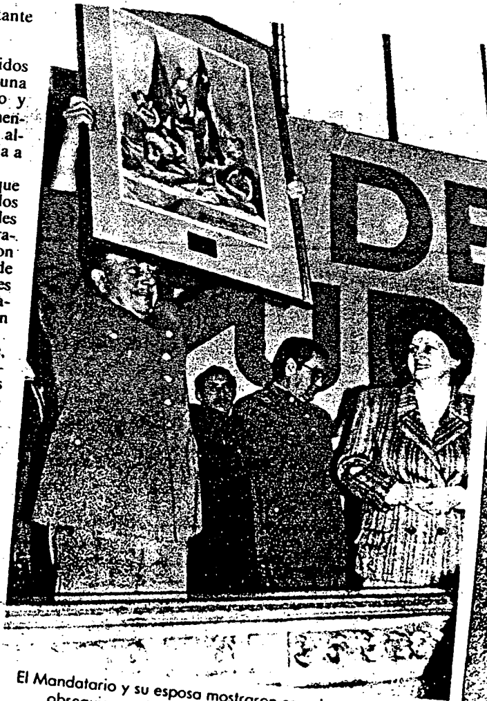
El Mandatario y su esposa mostraron complacencia por el obsequio que le entregaron jóvenes de la región.

Denunció también que, últimamente, han promovido una serie de incidentes por el caso de los dos jóvenes quemados. "Es muy curioso que la parka del que murió (Rodrigo Rojas Denegri) no estaba quemada por fuera. La quemadura es por dentro. No quiero pensar mal, pero me da la impresión de que, a lo mejor, llevaba algo oculto, se le reventó y le produjo la quemazón. Sin embargo, ha habido una campaña externa horrorosa; han atacado diciendo cuanto barbaridad se pueden imaginar. Yo espero que el señor juez (Ministro en Visita) descubra la verdad".