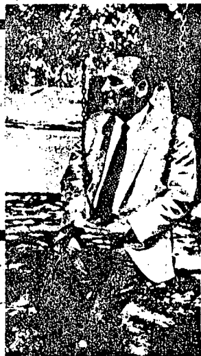
General René Peri, Ministro de Tierras y Colonización.