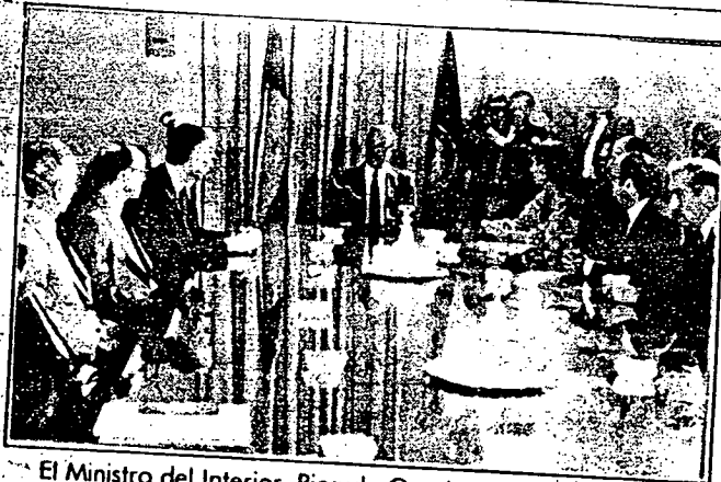
El Ministro del Interior, Ricardo García, reunido con la comisión asesora de leyes orgánicas constitucionales.

De acuerdo a lo informado por Sergio Fernández, los 12 cuerpos legales que deben ser elaborados son los siguientes: ley de base de procedimientos administrativos; ley que regula los conflictos de competencia entre las autoridades ad-