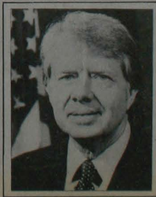
Jimmy Carter, ex Presidente de EE.UU. y director de la Fundación Carter-Menil.

Hasta ahora el premio se había otorgado anualmente a una o dos personas o